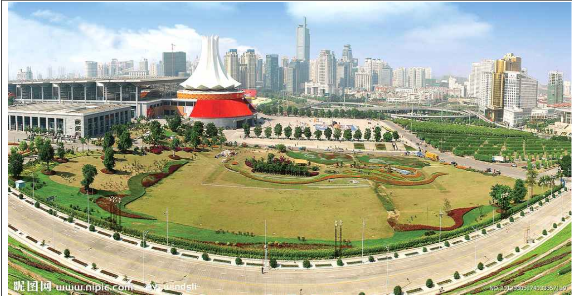
전경 및 홀 도면