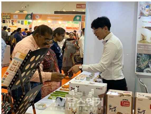
2019 인도 국제 무역 전시회(India International Trad Fair 2019) 참가

IITF는 B2B와 B2C가 혼재되어 있는 인도에서 개최되는 가장 큰 전시회로써 참가업체와 방문객 및 전문 바이어 뿐만 아니라 다양한 분야의 사람들을 만날 수 있는 전시회이다.