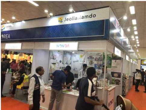
한국무역협회 광주전남지역본부와 전라남도가 중소기업의 해외진출 개척을 위해 지난 12일부터 18일까지 2019 인도 국제무역전시회에 파견한 6개 업체가 우수한 성과를 거두고 돌아왔다. 사진은 전남관 전경.

만은 전라남도에는 3개 중소기업체(벡터네이트, 천풍무인항공, (주)에이지유원)와 합심 파견, 제품 홍보 및 해외 바이어 수출 상담가 현지 시장조사 업무를 수행하여 바이어 수출 상담액 50만 달러 상당의 성과를 거뒀다.