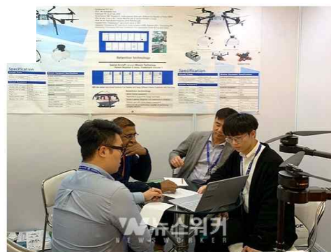
2019 인도 국제 무역 전시회(India International Trad Fair 2019) 참가

특기를 생산하는 벡터네이트코리아와는 현지 유통업자로부터 적극적인 러브콜을 받아 제작하는 (주)천풍무인항공도 성과 있는 수출 상담을 진행하여 향후 인도 시장 진출 가