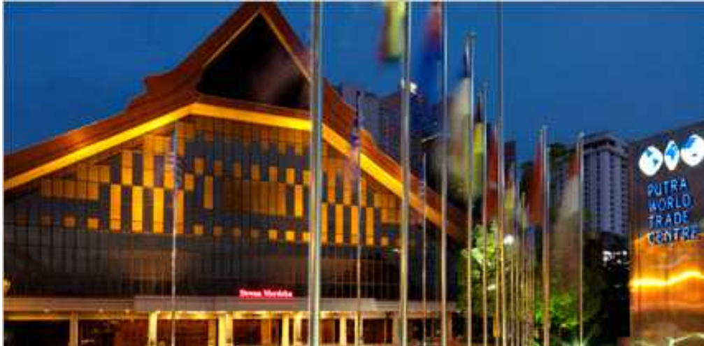
[PUTRA World Trade Centre]