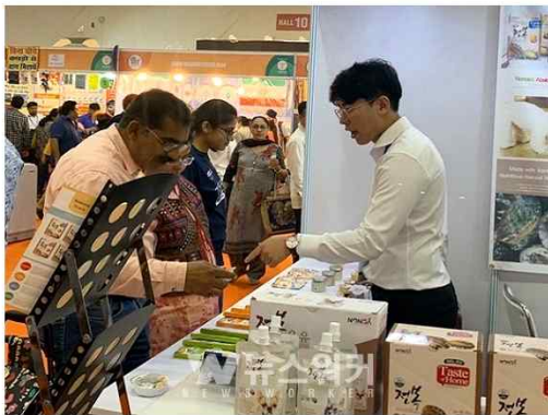
2019 인도 국제 무역 전시회(India International Trad Fair 2019) 참가