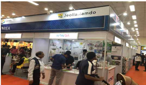
한국무역협회 광주전남지역본부와 전라남도가 중소기업의 해외판로 개척을 위해 지난 12일부터 18일까지 2019 인도 국제무역전시회에 파견한 6개 업체가 우수한 성과를 거두고 돌아왔다. 사진은 전남판권경. /무역협회 광주전남지역본부 제공

만은 전라남도에 있는 3개 중소기업(벡터네이트, 천풍무인항공, (주)에이지유원)와 합업 파견, 제품 홍보 및 해외 바이어 수출 상담가 현지 시장조사 업무를 수행하여 바이어 수출 상담액 50만 달러 상당의 성과를 거뒀다.